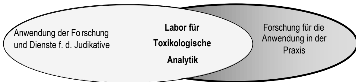
Abb. 2: Interdependenz von Forschung und Dienstleistung in der Forensischen Toxikologie. Im Zentrum stehen aufgabengerecht ausgestattete Labors.

Welche Ziele und Ausgestaltungen der Institutionen an einer Hochschule oder Universität de facto angestrebt werden, beruht auf vielschichtigen politischen Entscheidungen. Der Träger und seine verantwortlich Beauftragten bestimmen, wie eine Einrichtung strukturiert ist, was sie kosten darf, welcher Bedarf für ihre Existenz anzuerkennen ist. Man prüft so, ob rechtsmedizinische Institute sich rechnen bzw. angemessene wissenschaftliche und Lehrleistung erbringen. Innovativ angeleitete forensisch-toxikologische Wissenschaft und Labors können hier im Prinzip bestehen. In der Öffentlichkeit und vom Bedarf der Judikative her stehen die (zusammenfassend als rechtsmedizinisch bezeichneten) Leistungen auch nicht in